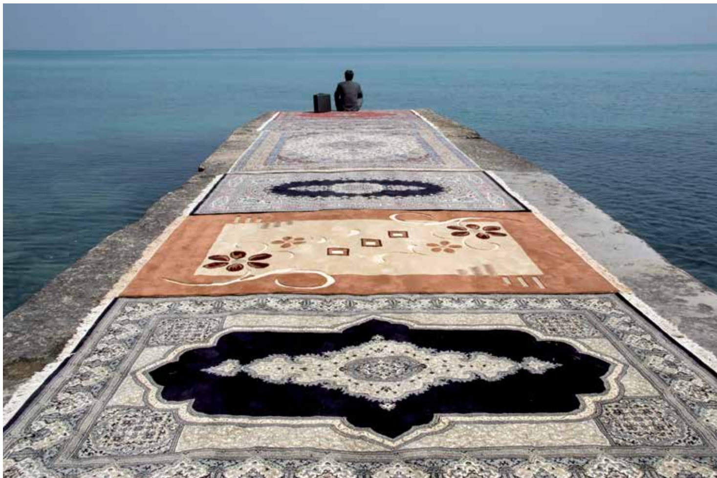
Water and Persian Rugs # 524, Jalal Sepehr, 2004, C-Print, 70 x 100 cm Exposition « Les Méditerranées » – du 2 septembre au 30 octobre 2013 – Marseille